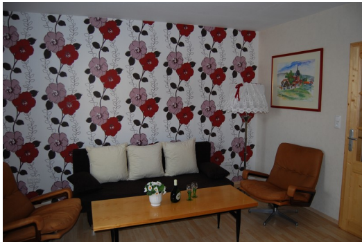
Wohnzimmer mit Schlafsofa