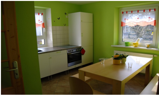
Küche mit Essecke

Die Ferienwohnung ist im Erdgeschoß. Der Eingang befindet sich an der Rückseite des Hauses. Die Wohnung verfügt über Wohnzimmer, Küche, Bad mit Dusche und zwei Schlafzimmer und bietet für bis zu sechs Personen gemütlich Platz.