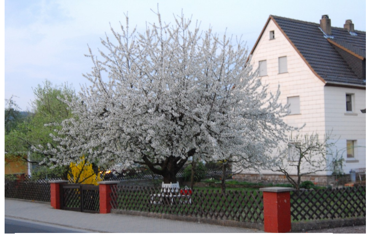
großer Garten und Terrasse am Haus